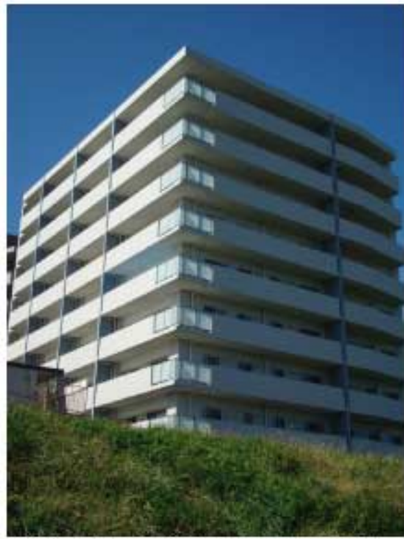
■建物外観 (平成22年2月9日撮影)