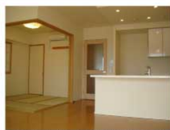
■リビング (平成22年2月9日撮影)