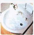
●洗面ボール みずはわかにくいく、すっきりしたラウンド形状です。